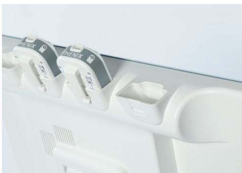
4 bases de carga para os PODs