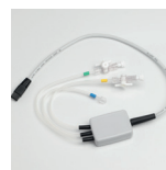
Manômetro 1, 2 ou 3 canais