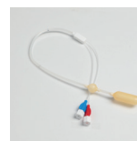
Sonda de pressão