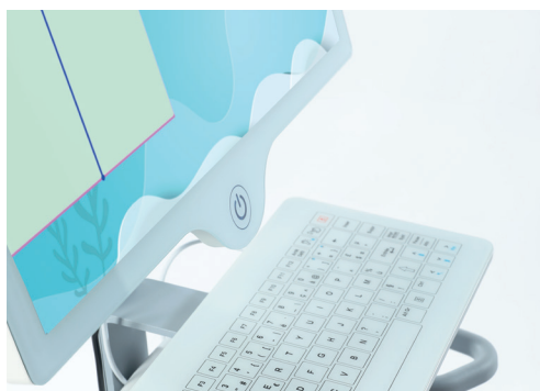
Teclado táctil com touchpad gigante integrado